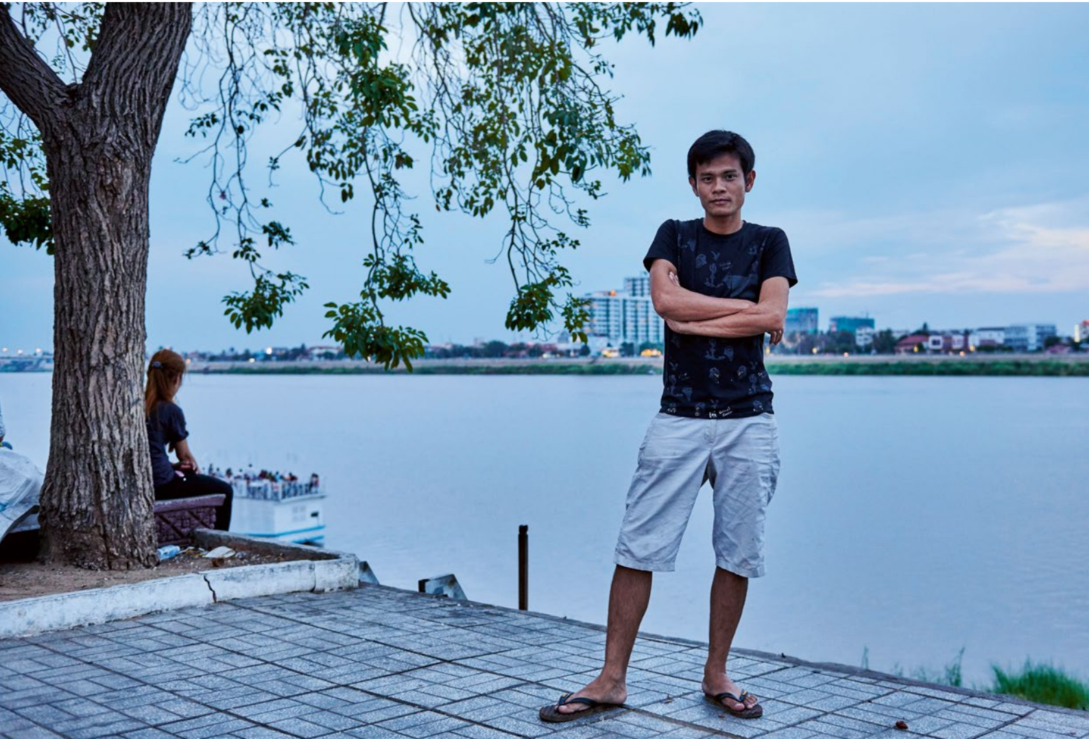
Ong Sowoint Planei am Fluss, ein beliebter Treffpunkt der Schwulen in Phnom Penh.