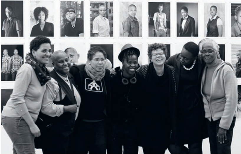
Zanele Muholi (in der Mitte)

bisch inspirierte Frauenbilder entworfen und durch ihre kreativen, akademischen und sozialpolitischen Arbeiten kommuniziert. Sie sind konkrete Beispiele für eine kontinuierliche intersektionale Kulturpolitik Schwarzer lesbischer Akteurinnen.