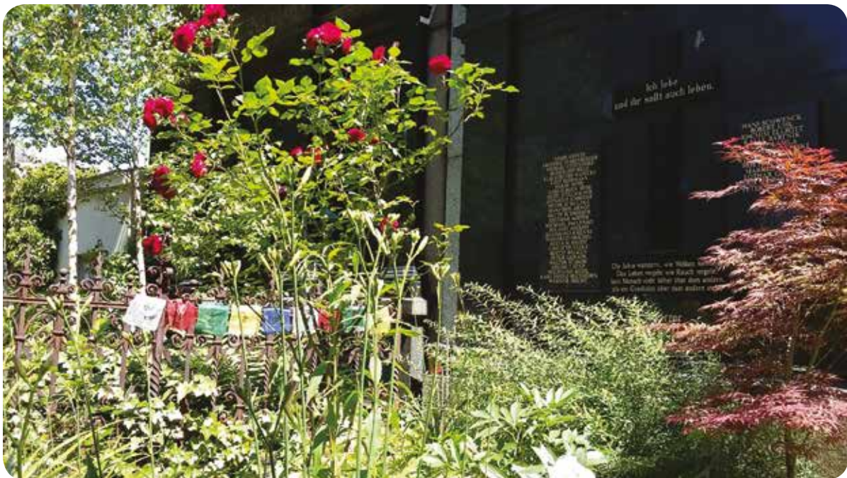
Das Grab mit vielen Namen in Berlin Kreuzberg

Aus intersektionaler und queerer Perspektive sehe ich die Praxis namentlicher Beerdigungen komplexer. Werden Namen auf die Grabsteine eingraviert, die in den Dokumenten genannt werden, oder selbstgewählte Namen? Bei Trans*, Inter* und genderqueeren Menschen, die keine Namensänderung vorgenommen haben, ist die Verwendung des Passnamens strukturell diskriminierend und führt damit auch zu einem Ausblenden von Trans*, Inter* und genderqueeren Lebensgeschichten. Die Idee, der Nennung des durch Eltern oder andere gegebenen, nicht selbst gewählten Vornamens bei der Beerdigung stellt eine cis 5 -Norm dar. Manche Namen werden beim Erhalt des deutschen Passes durch Behörden auch »eingedeutscht«. Diese rassistische Praxis wird nach dem Tod fortgeführt. Auch viele Menschen, die auf der Straße leben, verwenden einen anderen Namen als den Passnamen. Beim Grab mit vielen Namen wird wie bei »Hotte« Hädrich (29.12.1949–19.12.2012) auch der Name, den der_die Verstorbene auf der Straße verwendet hat, erinnert.