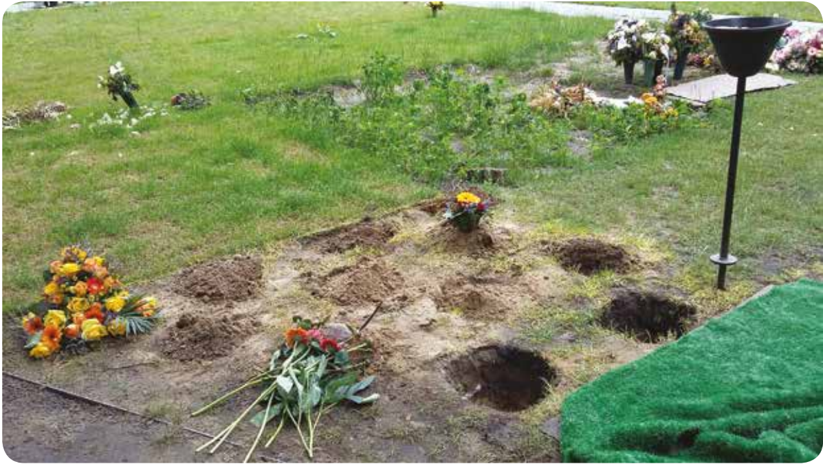
Ordnungsbehördliche Bestattung auf dem Parkfriedhof Neukölln.

Lebenspartner einer eingetragenen Lebenspartnerschaft, die volljährigen Kinder, die Eltern, die volljährigen Geschwister, die volljährigen Enkelkinder, sowie die Großeltern« (Senatsverwaltung für Gesundheit und Soziales, 2007). Freundschaften und soziale Bezüge jenseits von Herkunftsfamilie und »klassischen Kleinfamilien« werden nicht über den Tod des Menschen informiert.