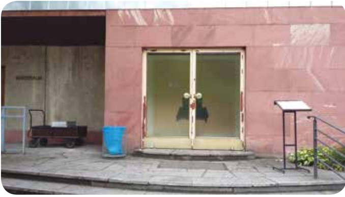
Feierhallen Parkfriedhof Neukölln. Links der Bollerwagen mit Urnenkasten. Rechts der Notenständer mit Informationen zum Ablauf der ordnungsbehördlichen Bestattung.